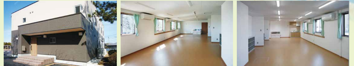
阿蘇米本学童保育所 ■1階/2部屋(学童) ■2階/2部屋(学童、放課後子ども教室)

米本地域の小学校の小規模化の課題解消とともに、子どもたちのより良い教育環境整備のため、現阿蘇中学校の位置に、令和4年4月に八千代市で初めての小中一貫校である義務教育学校「阿蘇米本学園」が開校します。先進校からは「一貫したカリキュラムによるスムーズな学習」や「異学年交流の促進」などの教育効果が報告されています。阿蘇米本学園では、独自教科の設定や5・6年生における教科担任制、小中合同の行事など1～9年生が同じ校舎で生活をするメリットを最大限に活かした学校運営が行われます。阿蘇米本学童保育所も、下の写真のように整備されました。